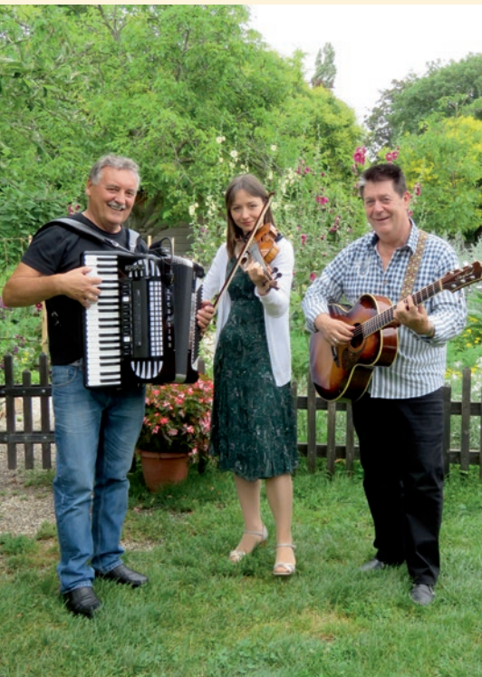
DIE NEUEN (Schrammeln)

Nach längerer coronabedingter Pause ist es wieder soweit! Wir laden Sie zu einem Rendezvous ins legendäre Café Schmid Hansl ein.