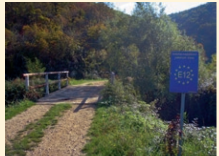
E12-Abschnittstafel im Mirna-Tal

Der Europäische Fernwanderweg 6 (E6) durchquert Slowenien von der steirischen Grenze am Radpaß bei Eibiswald bis zur Adria im Badeort Strunjan . Seine Verlängerung bildet der Europäische Fernwanderweg 12 (E12) durch Istrien bis Poreč in Kroatien. Dieser Weitwander-Führer, der im September 2022 im Klagenfurter Hermagoras-Verlag erschienen ist, ist der erste brauchbare in nicht-slowenischer Sprache für den E6 SLO, der erste überhaupt für den E12 CRO, und liefert alle notwendigen Informationen zur Durchquerung der vielfältigen Landschaften zu Fuß. Der Autor Martin Fürnkranz wird sein Buch im Rahmen eines etwa eineinhalbstündigen Lichtbilder-Vortrages präsentieren und auch Fragen aus dem Publikum beantworten.