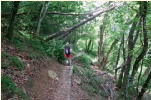
Dschungelpfad zw. Pomjan und Šmarje